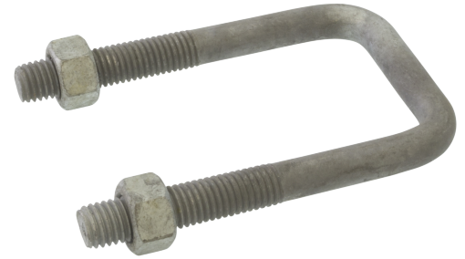
BR ... E