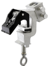
CD 74 AP