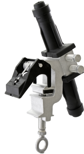
CD74 AG06 G