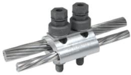
PGA 302 GCF