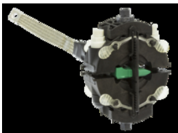
Version Tétrapolaire TTDS 4-05 I