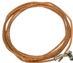
25 HURK V10X 2505