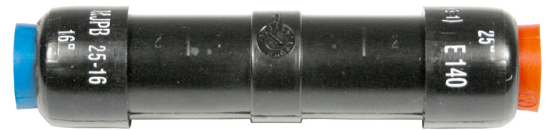
MJPB 25-16 CG

Mise en oeuvre : sertissage par rétreint hexagonal avec matrice E140.