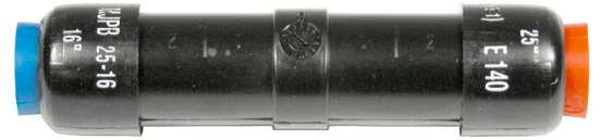
MJPB 25-16 CG

Mise en oeuvre : sertissage par rétreint hexagonal avec matrice E140.