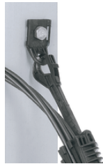
PA 69 F