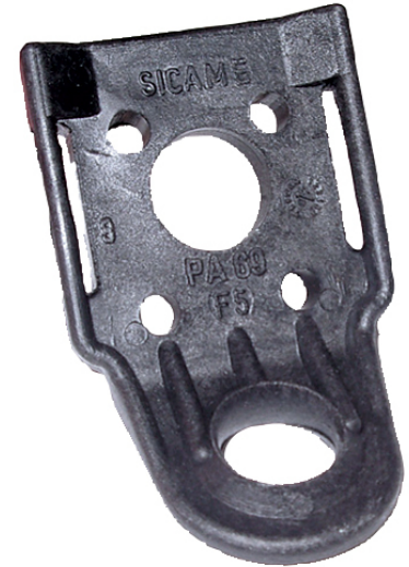
PA 69 F

Fixation par boulon Ø 16 mm ou feuillard (20 mm) ou 4 vis Ø 4 mm.