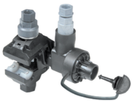
NTD 50-35 AFA