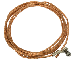
25 HURK V10X 2505