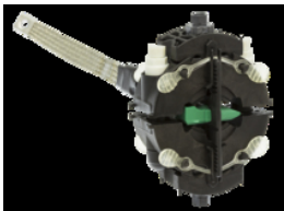
Version Tétrapolaire TTDS 4-05 I

Ces accessoires offrent la possibilité, suivant la configuration du réseau, de réaliser une version standard (avec mise à la terre) ou ISOL (isolé de la terre).