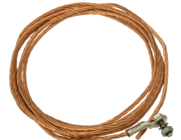
25 HURK V10X 2505