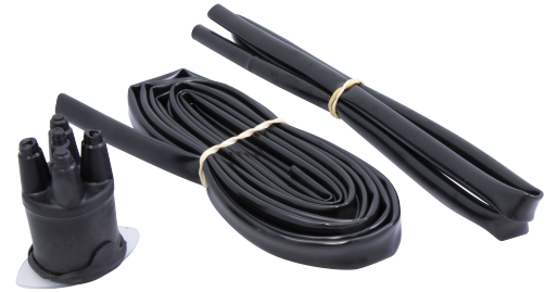
EE 5 TF