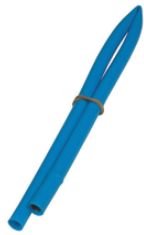
EI 5 TF