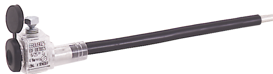
EBDU 90-25 N