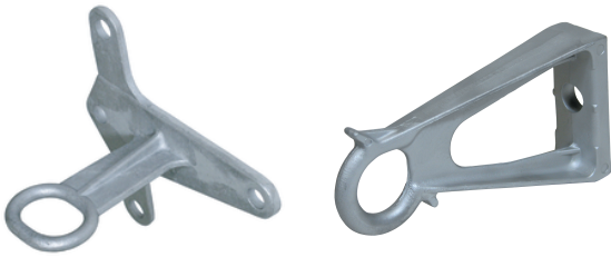
CS 10 W3