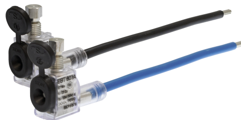
EBT 901 T2A

Version 2300 : Liaison constituée de deux connecteurs à perforation d'isolant.