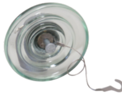
U40AP = U40 + TAPU40B