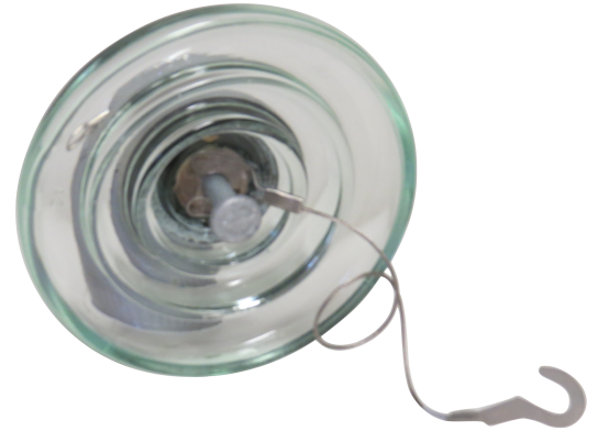
U40AP = U40 + TAPU40B

L'isolateur est composé d'un capot en fonte galvanisée, d'un élément diélectrique en verre trempé, d'une tige en acier galvanisé assemblés par ciment et d'une goupille en acier inoxydable.